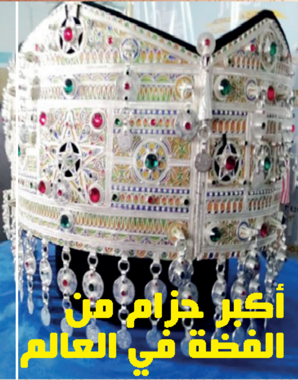
أكبر حزام من الفضة في العالم