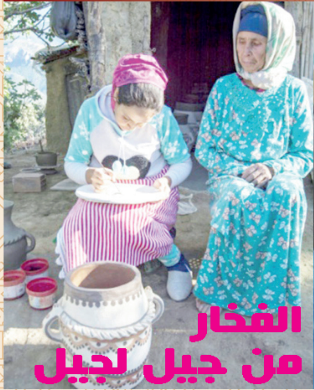
الفخار من جيل لجيل