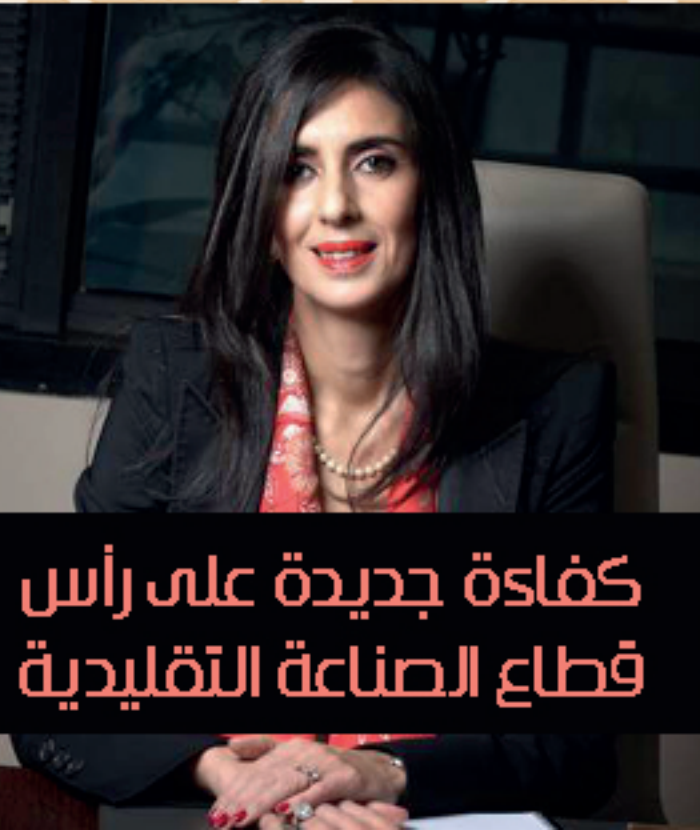
كفاسة جديدة على رأس قطاع الصناعة التقليدية