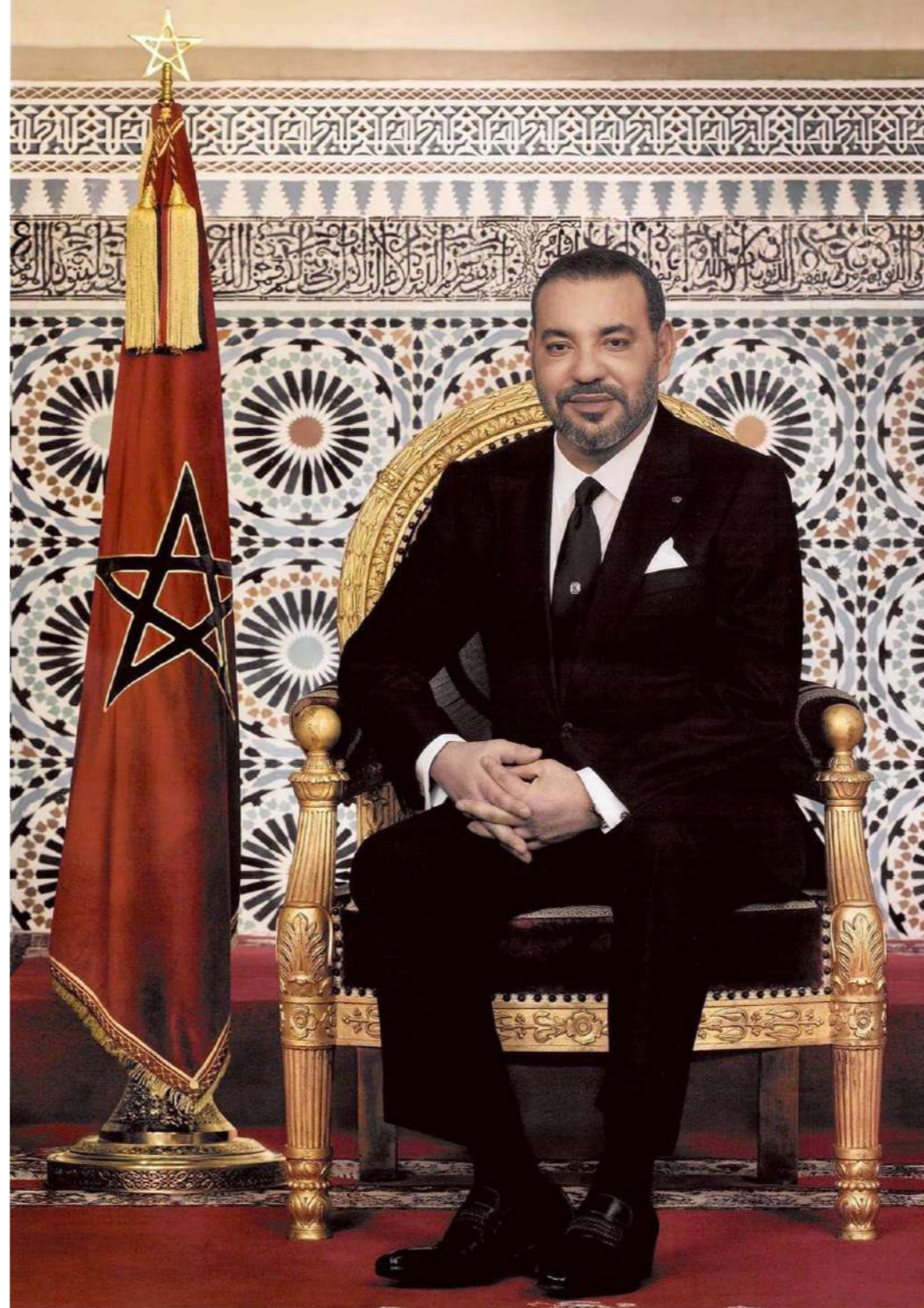
صاحب الجلالة الملك محمد السادس نصره الله