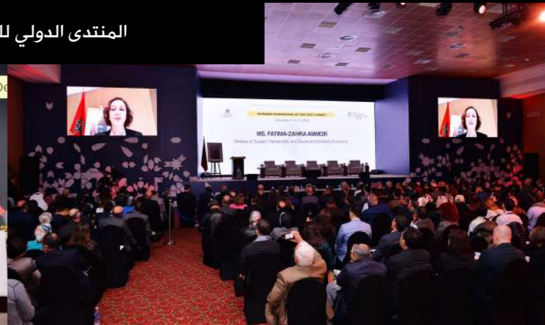
المنتدى الدولي للصناعة التقليدية