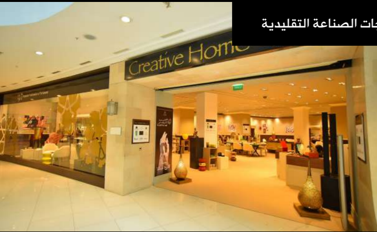
قاعة مؤقتة لعرض منتجات الصناعة التقليدية