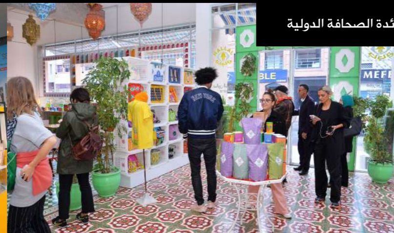
رحلة استطلاعية لفائدة الصحافة الدولية