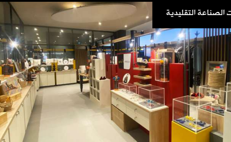
عمليات تسويق منتجات الصناعة التقليدية