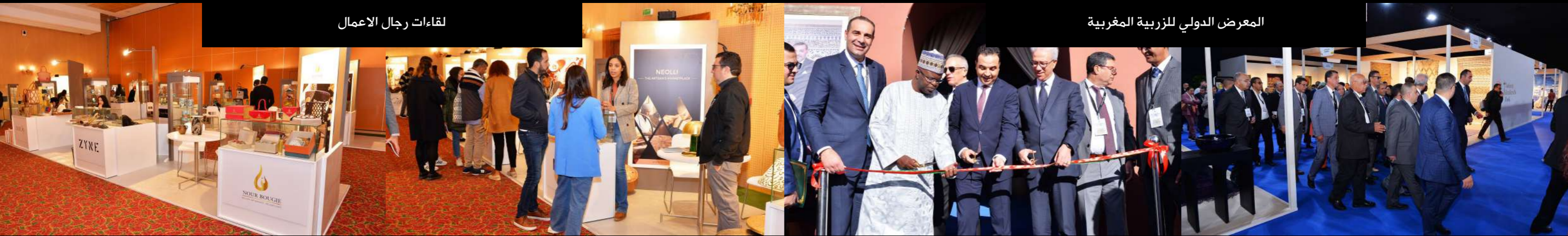
المعرض الدولي للزربية المغربية